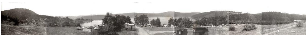
Panoramatický snímek tábořiště

V tomto zpravodaji Vám poskytneme informace o historii našeho kempu. Tento článek byl zveřejněn v rámci zahájení činnosti našeho obecního s.r.o. v Podskalí. Mnohé klienty článek potěšil. Nejen ty, kteří zde tráví rekreaci doslova desítky let, ale i klienty s kratší dobou působnosti.