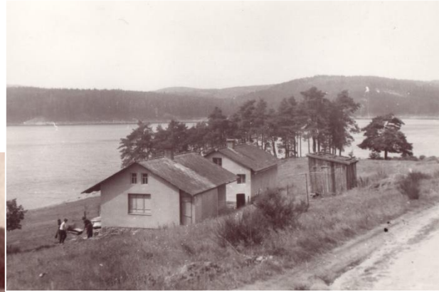
První dvě chatky na straně tehdejšího tábořiště

Již v roce 1969 vznikla žádost na odnětí ze zemědělského půdního fondu kvůli plánované výstavbě dvaceti chat na celkové rozloze až 80 000 metrů.